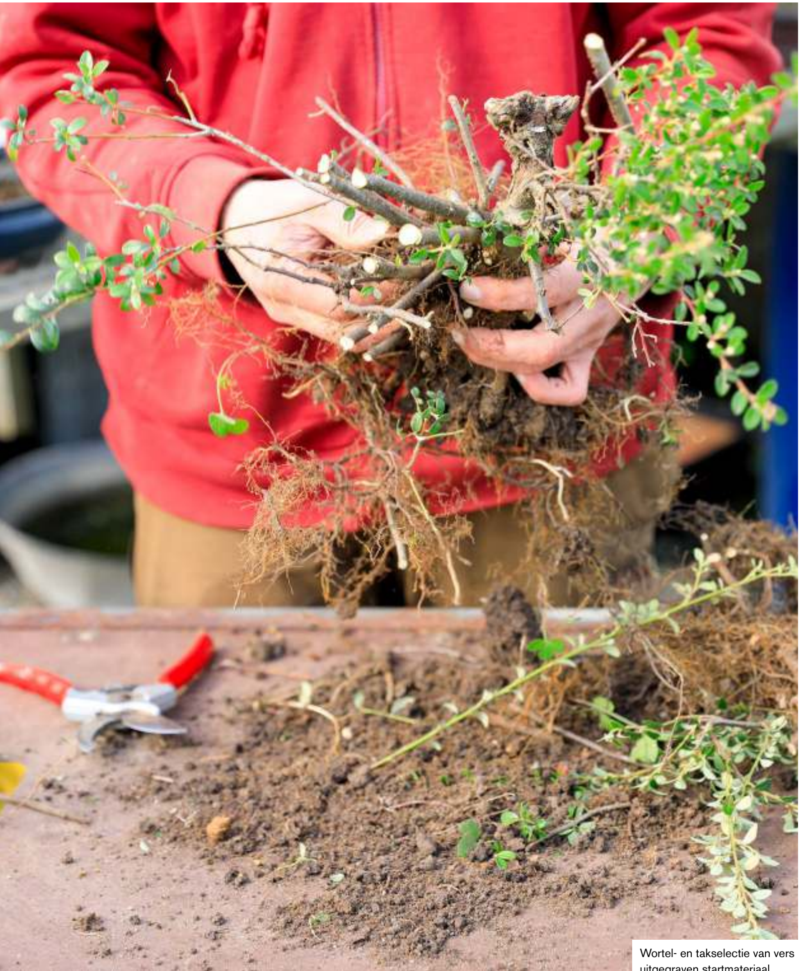
Wortel- en takselectie van vers uitgegraven startmateriaal.