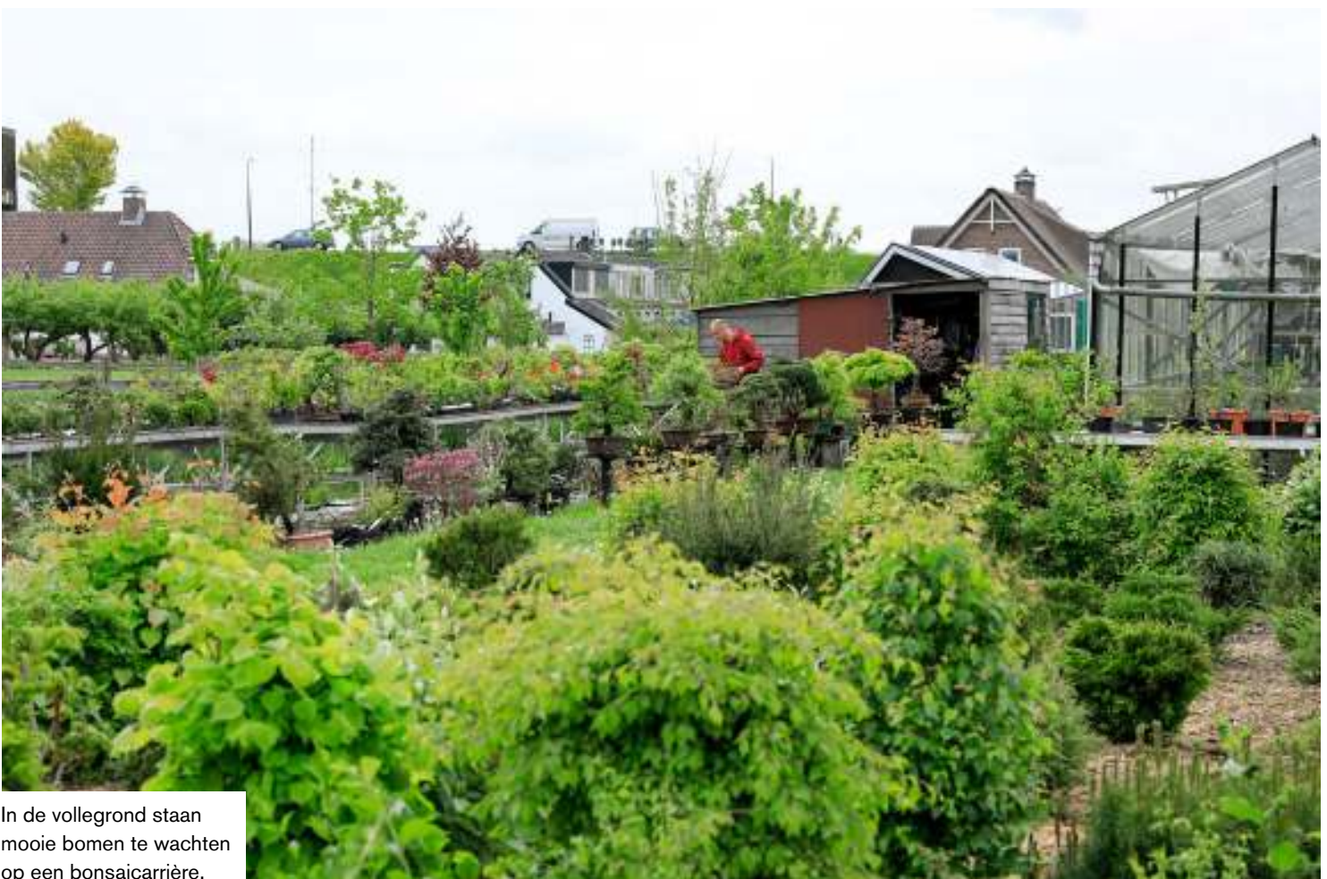
In de vollegrond staan mooie bomen te wachten op een bonsaicarrière.

z'n gezin in Schoonhoven, zo'n 25 uur per week brengt hij door op z'n kwekerij. "Ik geef elke dag water, één keer per week voeding over de bodem en één keer per week bladvoeding. Allemaal om de planten rustig, maar toch optimaal te laten groeien."